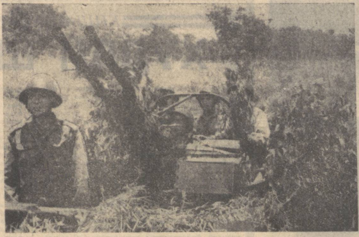
ЛАОС. Бу сурат мамлакат ватанпарвар кучлари назорат қилиб турган районлардан бирида олинган. Лаос ватанпарварлари чинакам мустанглик, тинчлик ва бетарафликка эришиш учун курашни давом эттиришмоқда...