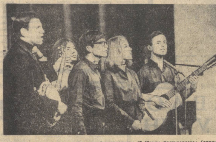
ЕШЛАР ва студентларнинг Софияда ўтказилган IX Жаҳон фестивалидаги Германия Демократик Республикаси делегацияси аъзолари Берлиндаги «Октябрь» клуби аъзолари ҳам бор. Улар фестивал катнашчиларини ўз мамлакатининг қўшиқ санъати билан таништирадилар.