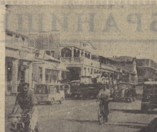
Бирма иттифоқи. Мамлакатнинг тўртдан бирдан кўпрогини эгаллаган Шан автоном давлати пойтахти — Таунджиннинг марказий кўчаларидан бири.