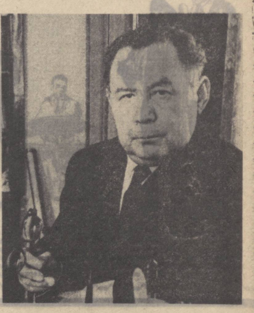
Мухаммад Ҳақиданинг портрети

Академик М. Урозбоев механиканинг лутф-карамларидан кишиларни баҳраманд қилиш мақсадида қатор дарслиқлар, пухта мазмундор илмий асарлар ёзган танлиқ олимдир.