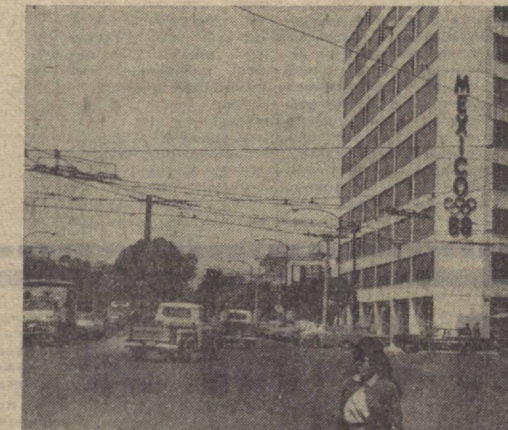
Мексика пойтахти олимпиадага тайёрланмоқда. Суратда: Мексика кўчаларида олимпиада эмблемаси.