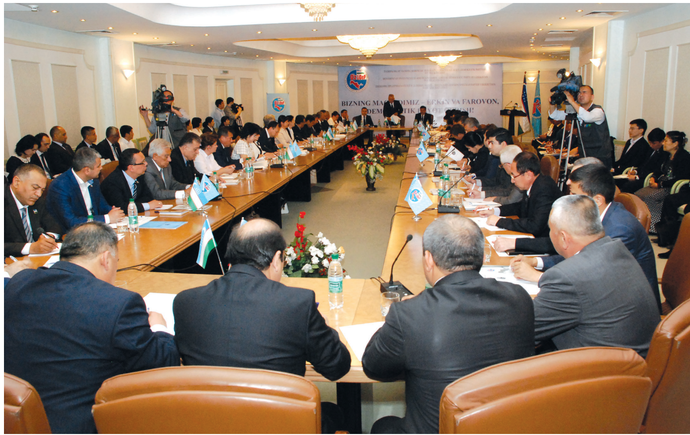
Солиқ ЗОИР олган сурат