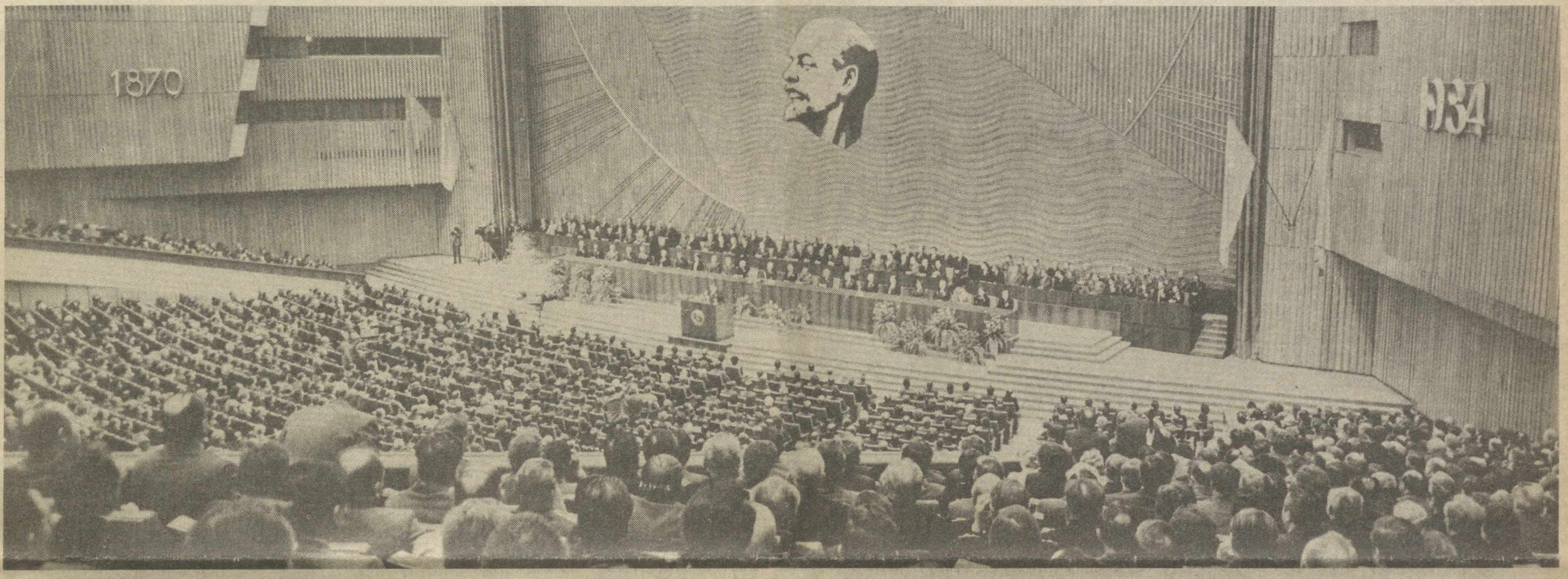
МОСКВА. 1984 йил 20 апрель. Кремлнинг Съездлар саройи. Владимир Ильич Ленин туғилган кунининг 114 йиллигига бағишланган тантанали мажлис.

(КПСС МАРКАЗИЙ КОМИТЕТИНИНГ 1 МАЙ ЧАҚИРИҚЛА РИДАН.)