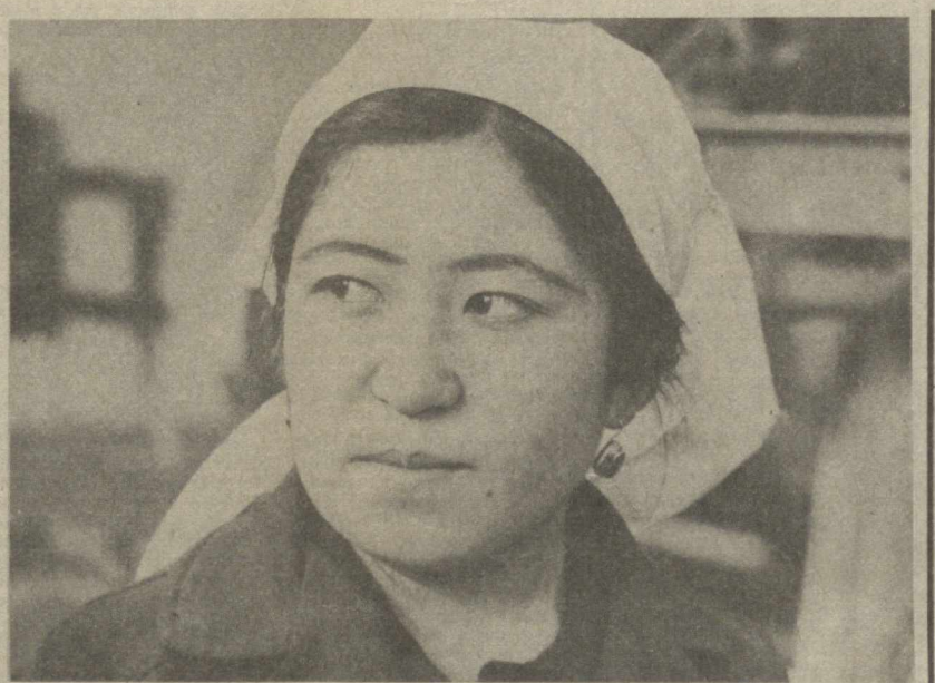
ЗАМОНДОШЛАРИМИЗ ТЎҚУВЧИНИНГ АХДИ

Мажлисда саяловчиларнинг СССР Олий Совети депутатларига берган нақазларини бажариш, Юстиция министрлигининг суд ижроиячи билан ишлашиш тақомиллаштириш тадбирлари ҳам кўриб чиқилди.