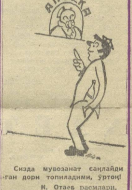
Сизда мувозанат сақлайди ган дори топиладими, уртоқ Н. Отаев расмлари.