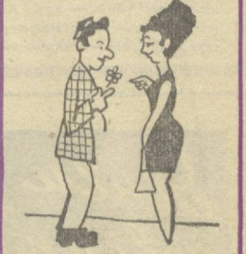
Киз — Сизга туришга чин кам қўлингизни совуқ сувга ҳам текизмайман.