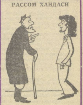
Уғлим, соҳ-соқолингги олдиранг бўлмайдин! Жуда алланечу бўлиб итиссан-чу.