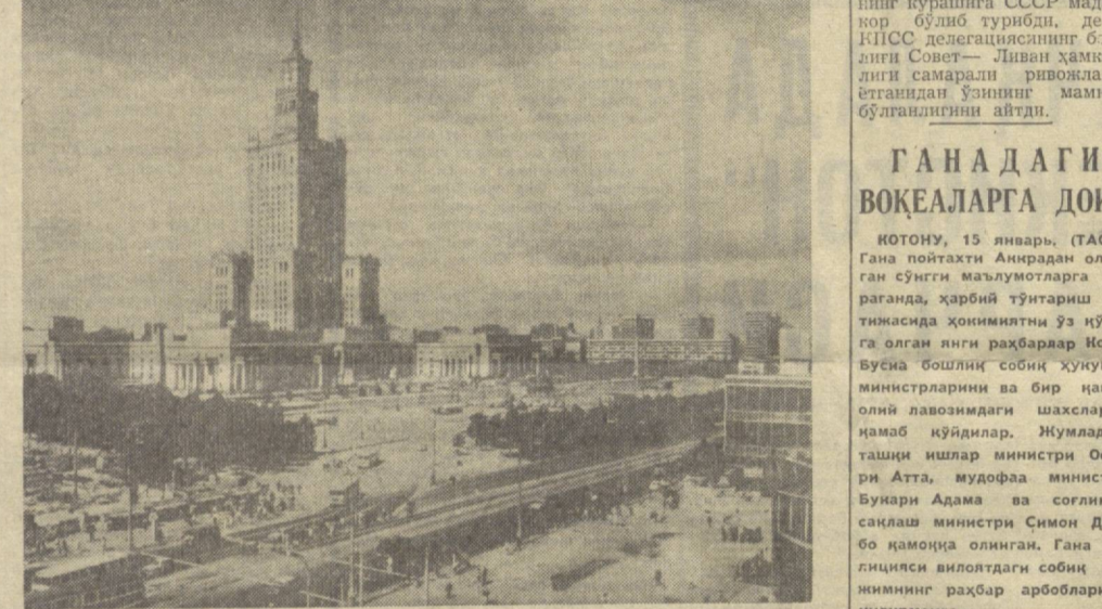
Суратда: Совет Иттифоқи томонидан соғла сифатида қуриб берилган Маданият ва фан саройи.