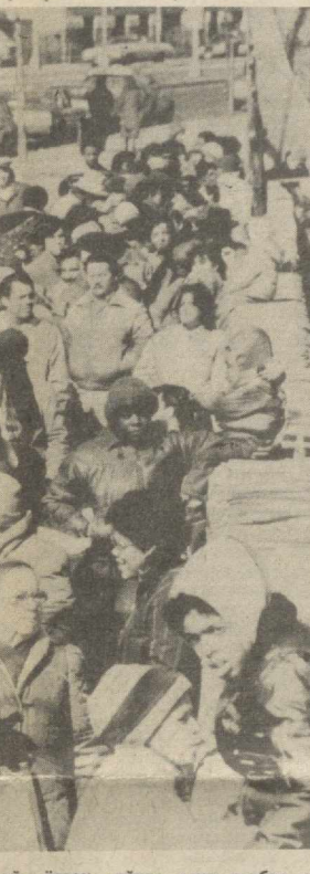
Нью-Йорк. Сиз суратда кўриб турган ушбу кишилар навабати Бронксдаги касалхоналардан бири биноси ёнимда бир неча кун давом этди. 15 мингга яқин оқ-наҳор американиклар бу ерда бепул оқ-наҳар берилишини сабр-қаноат билан кутиб турдилар. АДН агентлиги хабар қилганидек, ёгон шўрва учун навабат кутувчи оқлар сафи кейинги пайтда кўпайиб бормоқда. Мамлакатда оқлик ва қашшоқликнинг кучайиши Рейган олиб бораётган халққа қарши амилитаристик сиёсатнинг натижасидир.

Кейинги пайларда АҚШ маъмуриятининг ҳарбий тайёргарликка зўр бериши бутун тинчликсевар халқларнинг нафрат ва газабини кўзатишмоқда. Урушга қарши оммавий чиқишларнинг боиси шундан. Биз, совет халқи тинчлик тарафдоримиз. КПСС ва Совет давлатининг куч-ғайратлари ҳам ана шу мақсадга қаратилган. КПСС Марказий Комитетининг апрель Пленуми, СССР Олий Совети сессияси ҳужжатларида ва ўртоқ К. У. Черненконинг «Правда» газетаси саволларига жавобларида бу нерса ана бир бор қайд қилинди. Биз, ёшлар тинчлигини ҳимоя қилишга ўз ҳиссамизни қўшамиз. Партия қақирегага ҳар доим тайёрмиз. Истагимиз: Фақат Тинчлик бўлсин, токи уни ҳеч кимнинг ҳеч нерсасдан ҳимоя қилиш зарурати қолмасин. Бутун ер курреси узра кўш пурлаб турсин. Тинчлик қабутири ер шарининг мусаффо осмонида эркин парвоз қилверсин. И. ЖУРАЕВА, Шўрчи райони.