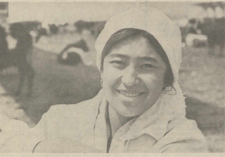
Фарғона райондаги «Еш ленинчи» саб-завотчилик совхозда чорвачилик маҳсу-лотлари тайёрлашга ихтисослаштирилган янги бўлиқ ташкил этилди. Давлатга 100 тонна гўшт, 170 миң дона тухум, 1000 тонна сўт етказиб бериш мажбурияти