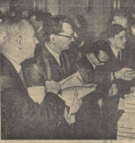
Хозир Гэрбий Германияда Гитлер билан қамовот бўлиб ишлаган нацистлар ишларини янада уларнинг қўлида. Давлатнинг энгасий-иқтисодий ва ҳарбий соҳаларидаги нацистларнинг қўлида қолган ҳужжатларни кўриб чиқаришда Германия Демократик Республикасида чинарилан «Сарик» китобида баъзи нацистларнинг баъзилари ҳақида маълумот берилган. Суратда: ГДР меҳнатқиллари ана шу китобни сотиб олмақдалар.