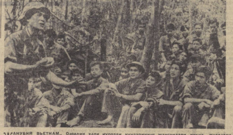
ЖАНУБИЯ ВЬЕТНАМ. Оқолиқ халқ қуролли кучларининг жангчилари қисқа мuddатли дам олиш пайтида ўз қуролдорининг хикосини тингашляпти.

● Греция бош министри Георгиос Пападуло 13 августда шаҳар ташқирисидида бодан Афинага келганда йўлда унга суиқасд қилинган. Рейтер агентлиги мухбирининг Афинадан берган хабаридида айтилишича, белгилаб кўйилган мuddатда портлаш лозим бўлган бомба бош министр тушган автомашини бомба кўйилган жойдан утишича бир неча секунд қолганда портлаган. Паладуло суҳбат зарар кўрмади.