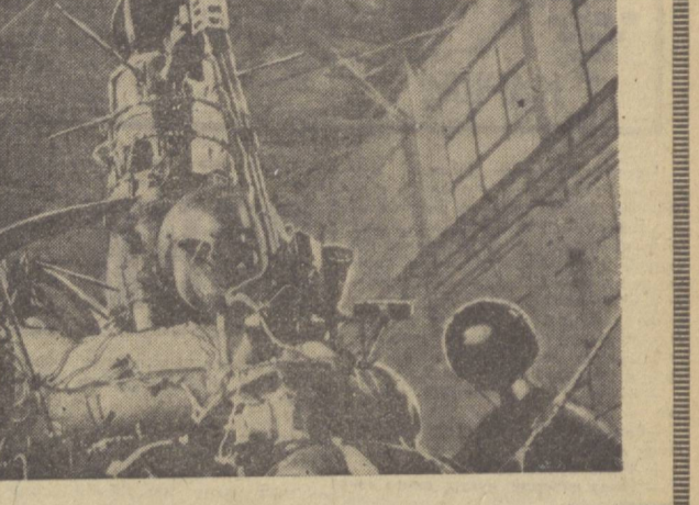
Суратларда: Планеталараро «Луна-20» автомат станциясига ўрнатилган ССР Давлат сифат белгиси ва виллелли тасвирланган, (Пастда) «Луна-20» автомат станцияси монтаж-синав юрлуси.