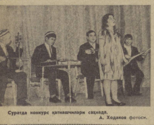
Суратда конкурс қатнашчилари сахнада.

Санаат — халқиники. Уни халқ яратди. Чинакам санаат халққа хизмат қилади.