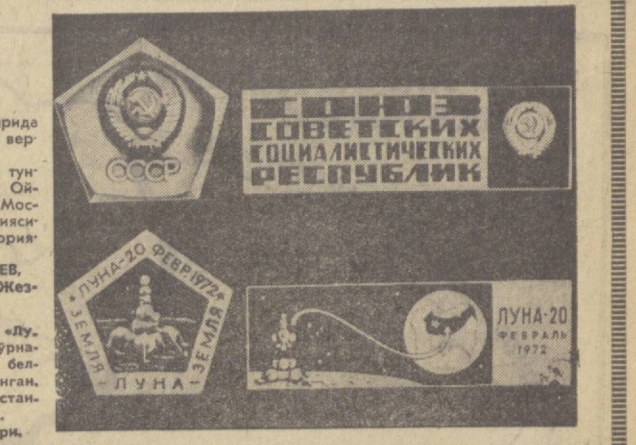
«ЛУНА-20» СТАНЦИЯСИНИНГ ҚАЙТАРИЛАВТАН АППАРАТИ ЕРГА ҚУТҚАН ЖОНДАН РЕПОРТАЖ