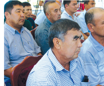
ли дастурларнинг фалар» мавзусидаги

таъкидланганидек, республика ҳудудларида озиқ-овқат саноати маҳсулотларини ишлаб чиқаришга ихтисослашган янги корхоналарни ташкил этиш, мавжудларини модернизация ва реконструкция қилиш бўйича 2015 йил учун белгиланган чора-тadbirkorлар доирасида 1300 та лойиҳа амалга оширилиши режалаштирилган бўлиб, ҳозирги кунда 332 та лойиҳа тўлиқ ишга туширилди. Бунинг учун ташаббускорларнинг 40 млрд. тижорат банкларининг 48 млрд. сўмдан ортиқ маблағи, 686 минг АҚШ доллари миқдоридида хорижий сармоялар ўзлаштирилди, 2454 та янги иш ўрни яратилди. 2015 йилда Қорақалпоғистон Республикаси ва вилоятларда кўп тармоқли фермер хўжаликларини ривожлантириш дастурига асосан 26 мингдан ортиқ лойиҳа амалга оширилиши кўзда тутилган бўлиб, ҳозирда чорвачилик,