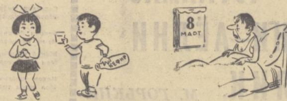
Изоҳнинг ҳолати йўқ.