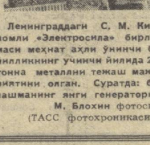
Ленинграддаги С. М. Киров номи «Электросила» бирлашмаси меҳнат аҳли ўн иккинчи беш йиллигининг учинчи йилда 2700 тонна металл ишлаб чиқаришнинг янги генератори.