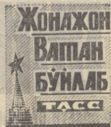
Новосибирскдаги қон айланиш патологияси илмий-тадқиқот институти ўзининг 20 йиллигини нишонлади.