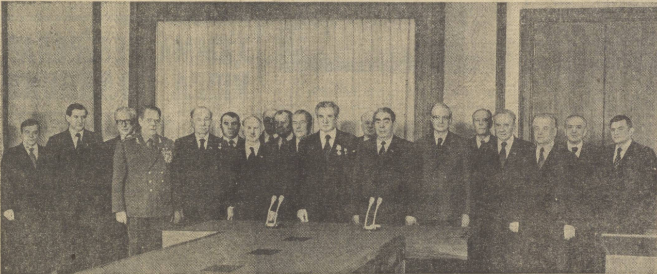
Мукофотларни тошпириш пайти.