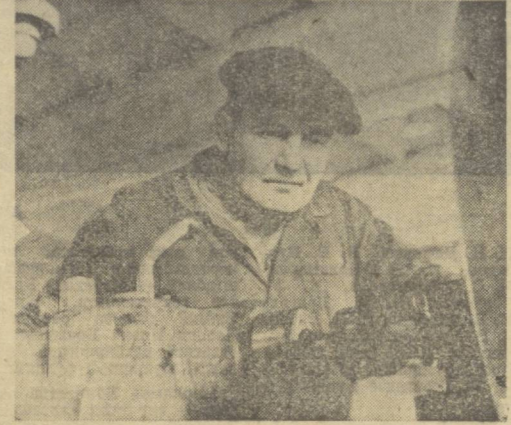
Фаргона области. Чиман ремонт-механика заводида илгор тонарлар ҳақида гап бораганда А. Метелевнинг ноияни хурият билан тилига олишди...