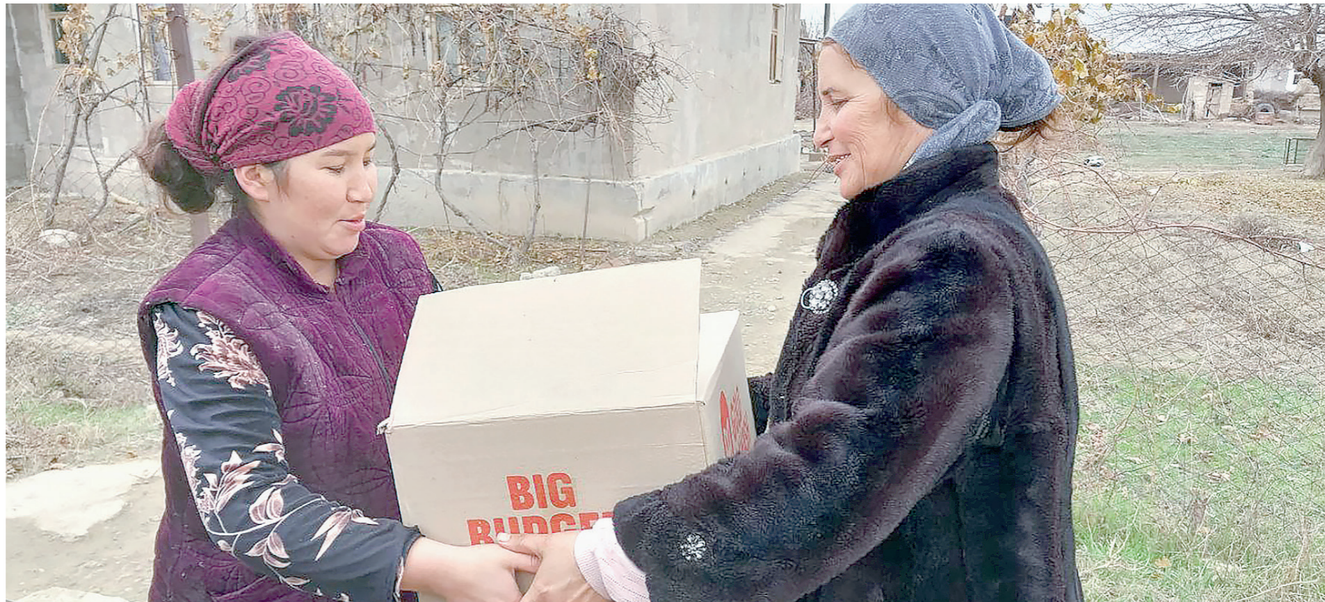
Аёлнинг оиласидан кўнгли тўқ, турмуш ўртоғи меҳрибон бўлса, энг қийин юмушларни ҳам уддасидан чиқади.