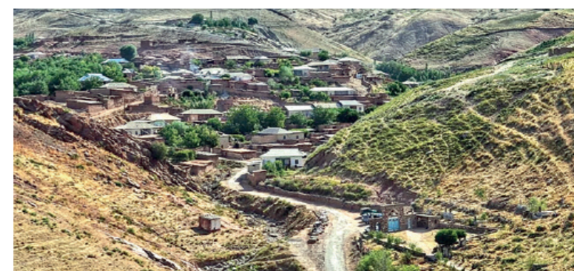
Лойиҳанинг 2022 йилдан то ҳозирги кунгача амал қилаётган биринчи босқичида Қорақалпоғистон Республикаси, Хоразм, Бухоро ва Навоий вилоятларининг 20 та туманидаги 170 та маҳаллада объектларни қуриш ва таъмирлаш ишлари давом этмоқда.

ва қишлоқ поликлиникалари каби ижтимоий соҳа объектларини қуриш ва реконструкция қилиш кўзда тутилган. Шунингдек, тегишли яшил ва энергия тежамкор ҳамда рақамли ечимлардан фойдаланган ҳолда, қишлоқларни ривожлантириш режалари ишлаб чиқилади. Лойиҳани амалга ошириш натижасида 622 мингдан зиёд қишлоқ аҳолисининг турмуш шароити яхшиланиши режалаштирилган.