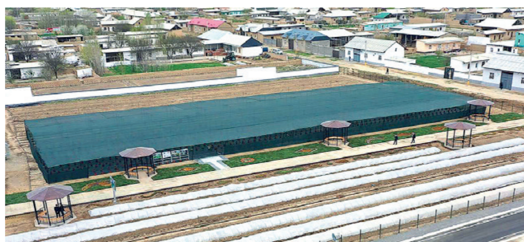
Лидер тadbиркор – экспортчи учун ҳар бир маҳалла ихтисослашувидан келиб чиқиб томорқада 50 миллион сўм даромад қиладиган молиявий хизмат пакети ишлаб чиқилади.

Маҳаллада резавор мевалар етиштириш бўйича ўқув майдони ташкил этилган. Бу ерда маймунжон, хўжағат, голубка кучатлари ўстирилиб, томорқаларда экилади. Хосилга киргач, экспортчилар сотиб олади. Президентимиз томорқа эгаларига бу меваларни сифатли етиштириш илмини ўргатиш муҳимлигини таъкидлади. Бу лойиҳани кенгайтириш, аҳолининг харид қобилиятини ошириш учун томорқа эгалари