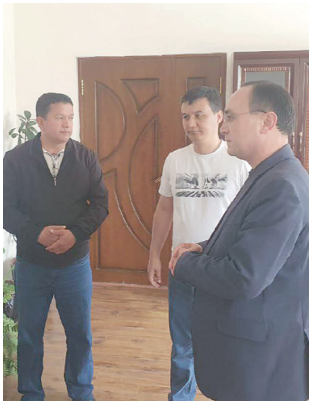
Ғиждувон туманидаги Абдулла Қаҳҳор номли маҳаллада яшовчи кулол Нарзуллаевлар хонадонига таширф буюрилди.

*** Навоий вилоятида Ўзбекистон маҳаллалари уюшмаси масъулларидан иборат ишчи гуруҳи ўрганишлар олиб бормоқда. Хусусан, Ҳозор шаҳри, Нурота ва Хатирчи туманларида аҳоли билан мулоқотлар олиб бориляпти. Унда "маҳалла еттилиги", аҳолининг томорқадан фойдаланиш маданияти, ёшларга ажратилаётган ер майдонлари кўздан кечирилмоқда.