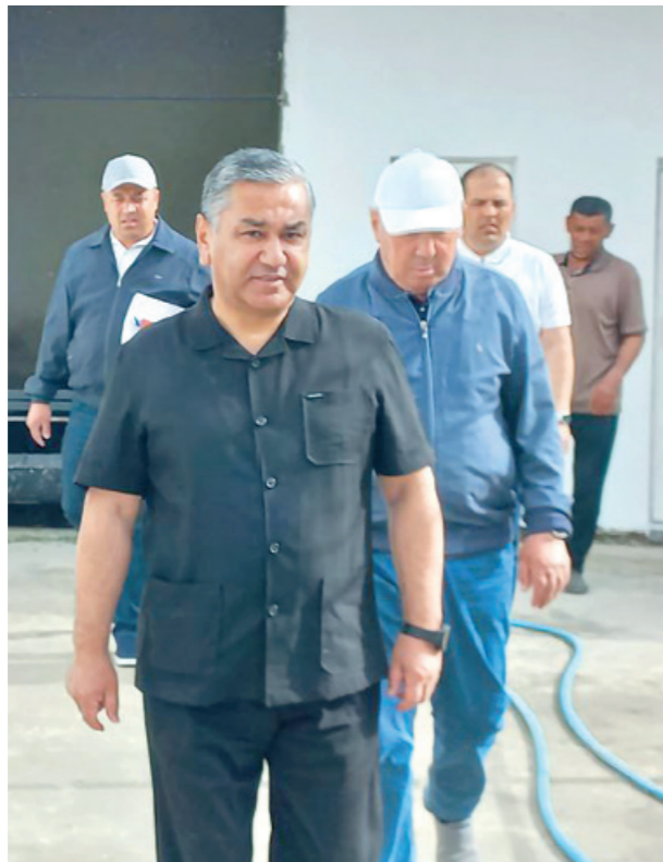
Давоми. Бошланиши 1-саҳифада.

Президентнинг "Маҳалла институтининг жамиятдаги ролини тубдан ошириш ва унинг аҳоли муаммоларини ҳал этишда биринчи бўлин сифатида ишлашни таъминлашга қаратилган чора-тадбирлар тўғрисида"ги фармони ҳамда "Ўзбекистон маҳаллалари уюшмаси фаолиятини йўлга қўйиш ва маҳаллаларда бошқарув тизимини такомиллаштиришга оид қўшимча чора-тадбирлар тўғрисида"ги қарори ижроси юзасидан тушунтиришлар берилди.