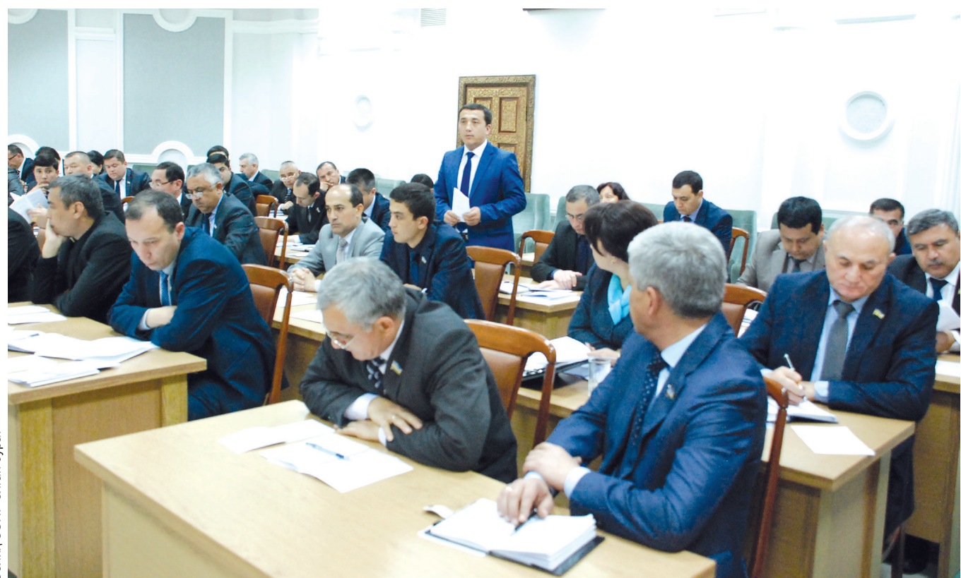
Сопиқ ЗОИР олпан сураб