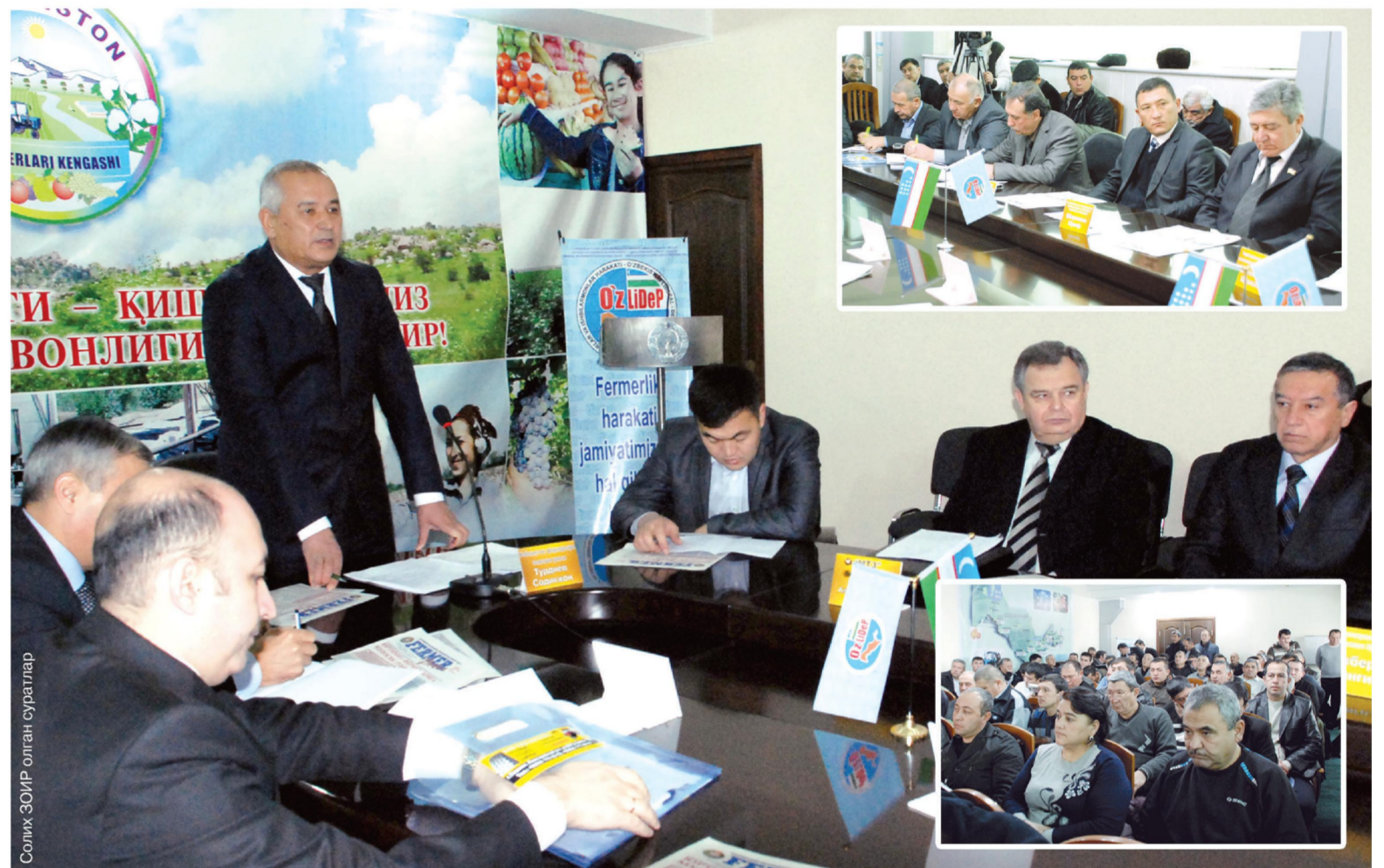
Солима ЗОИР олган суратлар

Ўзбекистон Либерал-демократик партиясининг Фермерлар кенгаши билан ҳамкорликда ташкил этилган «Фермер хўжалиқларининг моддий базаси ва техник жиҳозланганлик даражасини янада мустаҳкамлашга оид долзарб масалалар» мавзусидаги давра суҳбатида Президентимиз Ислам Каримовнинг «Ўзбекистонда фермерлик фаолиятини ташкил қилишни янада такомиллаштириш ва уни ривожлантириш чоратадбирлари тўғрисида»ги фармонида белгилаб берилган вазифалар ижроси муҳокама қилинди