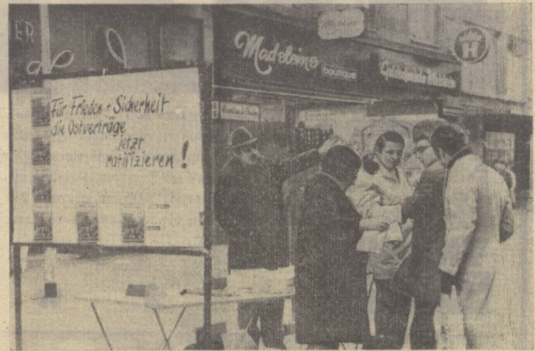
Германия Федератив Республикасининг прогрессив жамоатчилиги ва Ғарбий Германия аҳолисининг кўпчилиги Москва ҳамда Варшава имзоланган шартномаларнинг тасдиқ...