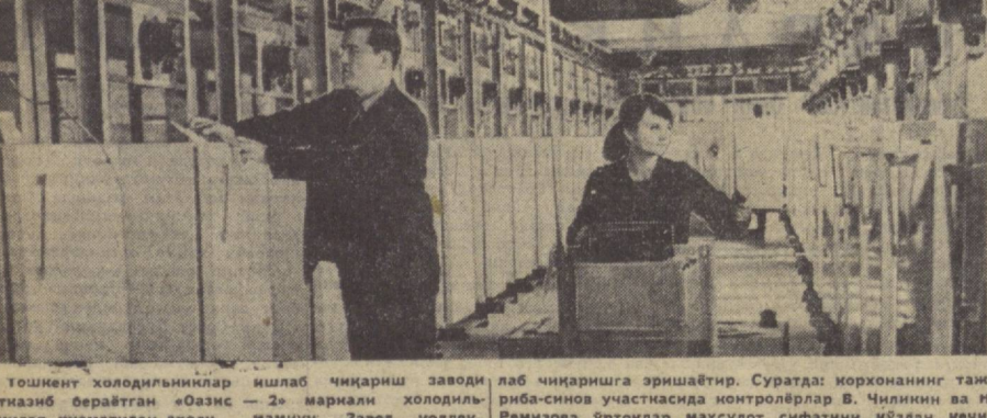
Тошкент холодильниклар ишлаб чиқариш заводи, лаб чиқаришга эришаётир. Суратда: корхонанинг таъминот бераётган «Оазис — 2» маркази ходолиқ-риба-синав участкасида контролёвлар В. Чилинин ва И. никлар Хизматдан аҳоли наминун. Завод илгорек. Ремизова ўртоқлар маҳсулот сифатини кўздан кечитивн ҳар нуни 280 донага етказиб ходолиқлик иш-ришяпти.