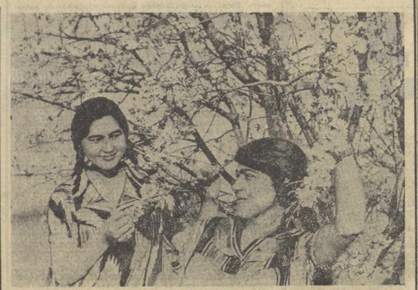
Баҳор республикаимизнинг ҳамма об-ластларида кўнрам сеп ёйди. Боғлар, тоғ ёнбағирлари, адирлар гул-чечаклар билан ба-занди. Мевали дарахтларнинг кўнрам гуллари дилларга завқ-шаҳқ баҳш этмоқда. Суратда сиз ана шундай манзараларнинг бирини кўриб турибсиз.