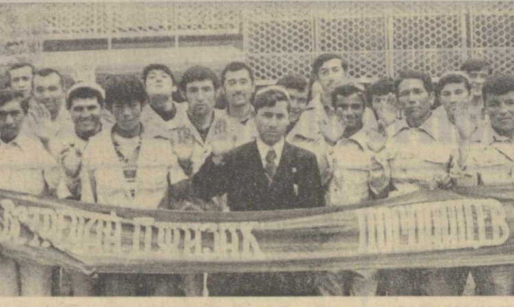
Суратда: Жижзах чўлини ўзлаштиришга отланган комсомол-ёшлардан бир гуруҳпаси.