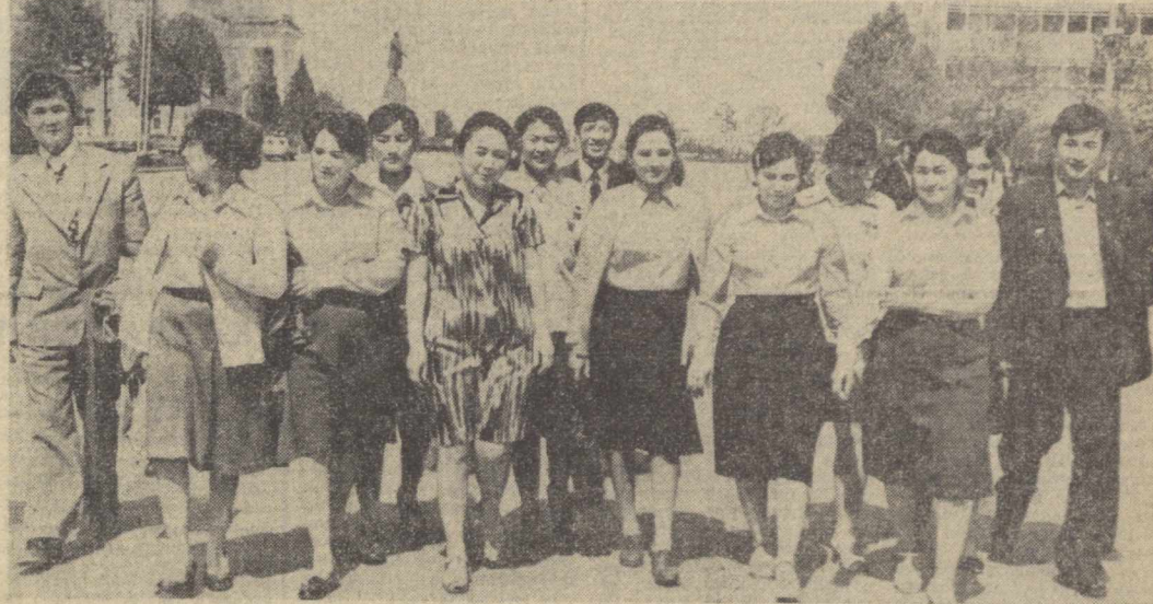
ВЛКСМ XVIII съезидо сайланган ўзбекистонлик делегатлар пойтахтимизнинг бош майдонидо.

А. А. Громико шу кунлик Софияга келди. (ТАСС).