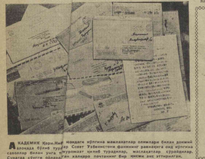
АКАДЕМИК ҚОРИ-НИЁЗИЙ ўзиданги кўпгина мамлакатлар олимлари билан доимий алоқада бўлиб турган Совет Ўзбекистони фанининг равангига оид кўпгина саволлар билан унга муражат қилиб турадилар, масалалар сўрайдилар...

бўлмайди. Содир бўлганда эса у, зоҳири бўлиб, айб фанда эмас, балки бизнинг ўзимизда бўлади.