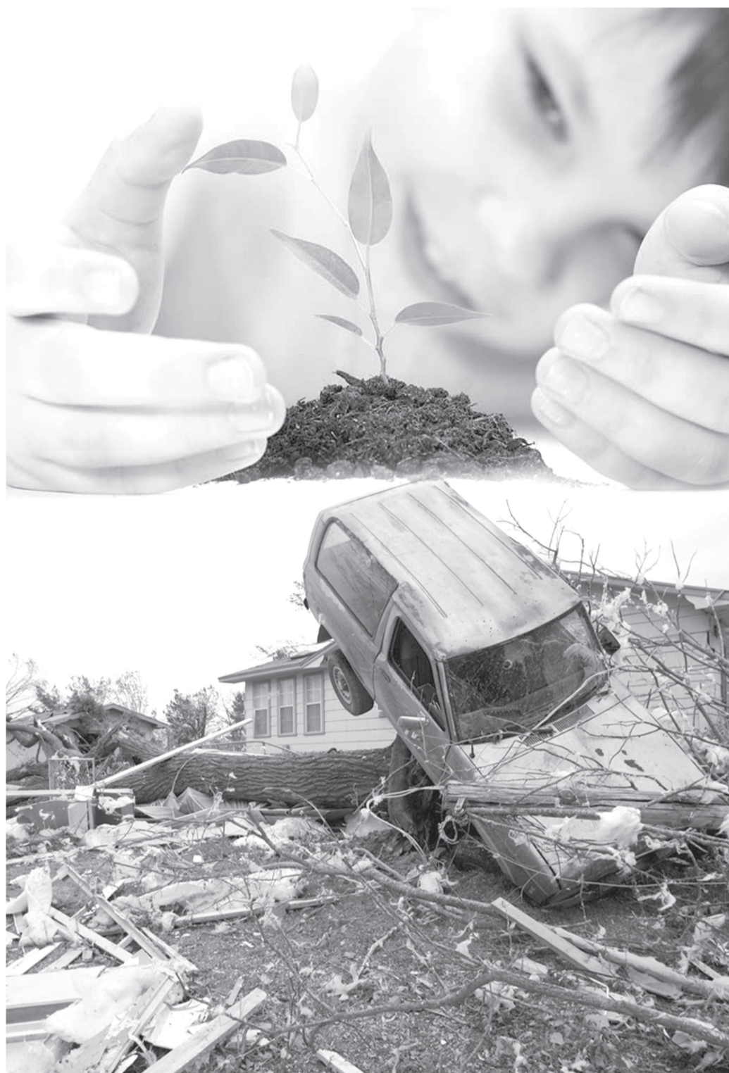
Ақбар МУЗАФФАРОВ, «XXI asr»

2013 йилда глобал исиш сабабли юз берган сув тошқинлари, довул, қурғоқчилик ва бошқа табиий офатлар натижасида дунё иқтисодиётига етказилган зарар миқдори 200 млрд. АҚШ долларига етди