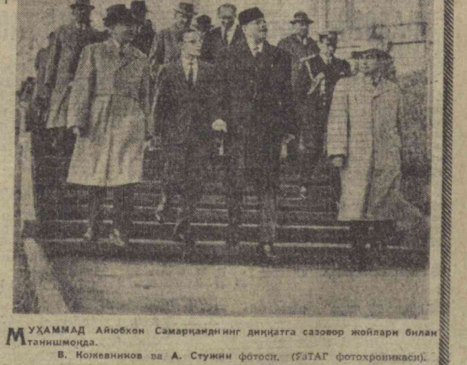
МУҲАММАД АЙЎБХОН Самарқанднинг диққатга сазовор жойлари билан танишмоқда.

Шарафига қабул маросими ўтказилди. Қабул маросими самимий дўстона ваъжидда ўтди. Қабул маросимида Ўзбекистон ССР Олий Совети Президиумининг Раиси Е. С. Насриддинова ва Муҳаммад Айюбхон нугўқ сузладилар (ЎзТАГ).