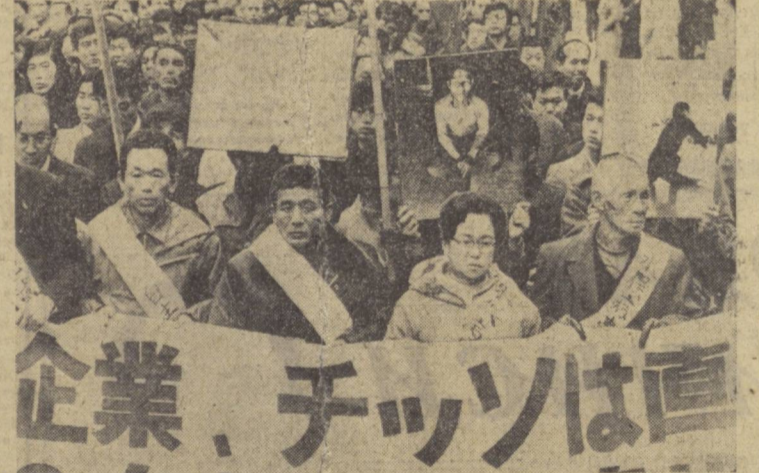
Японияда ҳар йили 8,6 миллион тоннадан зиёд балик истеъмол қилинади. Шунинг учун ҳам баликчилик биринчи бўлиб денгиз сувларини саноат қилитилари билан инфолаштириб таш маъмулиятсиз қорчалонларга қарши норозилик билдириб намойиш уюштирилди. Соқил бўйи сувларнинг инфолаштирилиши баликларнинг кўпчилик нетишига ёни оғират учун японсиз бўлиб қолишига сабаб бўлмоқда. Норасий маълумотларга қараганда, закарданган сувдаги баликни истеъмол қилиш натижасида 10 мингдан зиёд киши насалга қадалинган, 40 киши эса ўлган. Суратда: намойишчилар денгиз сувларини саноат қилитилари билан инфолаштирилишига қарши норозилик билдирмоқдалар.

Республика аҳамиятига эришган шахсий пенсионер, Меҳнат Қизил Байроқ орденли В. И. Ленин номи Тошкент давлат университети тупроқшунослик кафедрасининг собиқ мудири, Ўзбекистон ССРда хизмат кўраётган фан арбоби, профессор Михаил Александрович Орлов тўсатдан вафот этди. М. А. Орлов 1888 йилнинг 20 февралда Москва шаҳрида туғилди. У 1912 йилда Москва давлат университети тупроқшунослик кафедрасининг тупроқшунос-ўқитувчиси бўлиб ишлашдан меҳнат фаолиятини бошлади. 1920 йилда Совет ҳукумати Тошкент шаҳрида давлат университети ташкил этиш тўғрисида қарор қабул қилганидан кейин М. А. Орлов уш яилнинг 10 апрелида В. И. Ленин йўналиши билан «бир гурупа» ўқитувчилар қатори биралиса, кадрлар таъбирлаш ёрдами билан Тошкентга келди. Орлов 1905 йилдан 1962 йилгача Ўрта Осиё давлат университети — Тошкент давлат университети тупроқшунослик кафедраси ишига раҳбарлик қилди ва кафедрани 250 дан кўпроқ тупроқшунос таъинлади. М. А. Орловнинг фаолиятига юксак баҳо берди. У Меҳнат Қизил Байроқ орденли, бир неча медаллар ва Ўзбекистон ССР Олий Совети Президиумининг Фахрий брлялари билан мунофотланди. 1944 йилда оса Михаил Александрович Ўзбекистон ССРда хизмат кўраётган фан арбоби фахрий унвонини олишга сазовор бўлди. Алоҳида меҳнатсевар олим ва ўртоғимиз М. А. Орловнинг ёшлар хотираси унинг шогирдлари ва бутун университет коллективли қалбига ҳамisha сақланиб қолди. Бир гурупа ўртоқлари. Редактор М. ҚОРИЕВ.