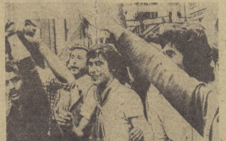
Италияда парламент учун бўладиган сайловлар муносабати билан Коммунистнинг партияннинг митинг ва мажлислари бўлиб ўтмоқда. Митинг ва мажлисларда қатнашаётган Италия Компартиясининг танини арбоблари нег омиа мафазатини ҳимоя қилаётган Италия Компартияси учун овоз беришга қақирмоқда. Суратда: Римдаги митинглардан бирини.