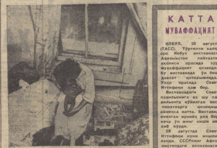
АҚШ. Қашшоқлик, фониали ҳаёт бугунги Америкага хос бўлиб қолди. Америка Қушма Штатларининг 100 дан ортиқ янги шахарларида негрларнинг қулай-қулай деб турган уйлари бор...