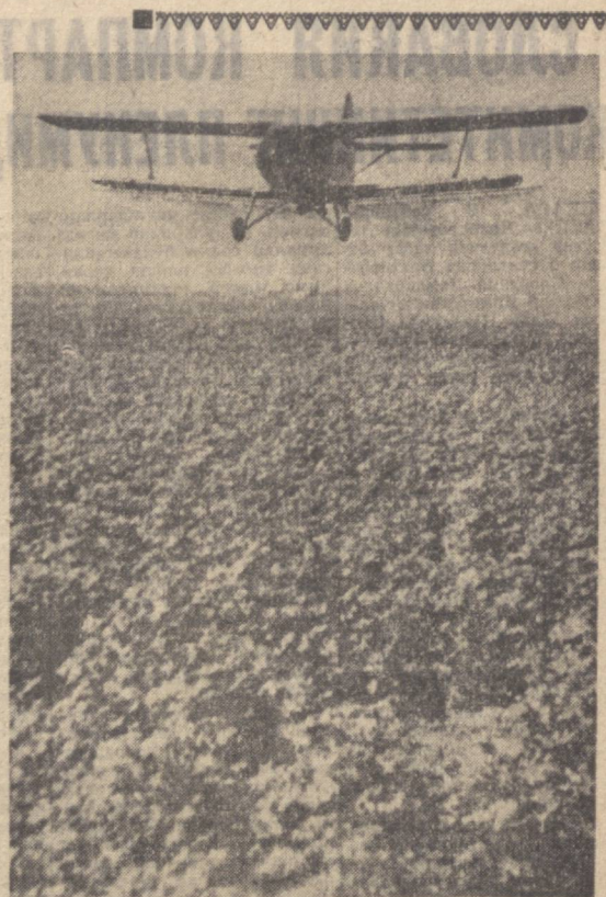
Грамдан ҳаво флотини учувчиларини пахтакорлар уларнинг нотули дўстлари деб билишди, Бунинг ани шу суратда ҳам кўриб туришимиз. «Хазорбоғ» совхозини пахта даладарига самолётдан дори сеппилмоқда.

Э. ЭРГАШЕВ, «Хазорбоғ» совхозининг директори.