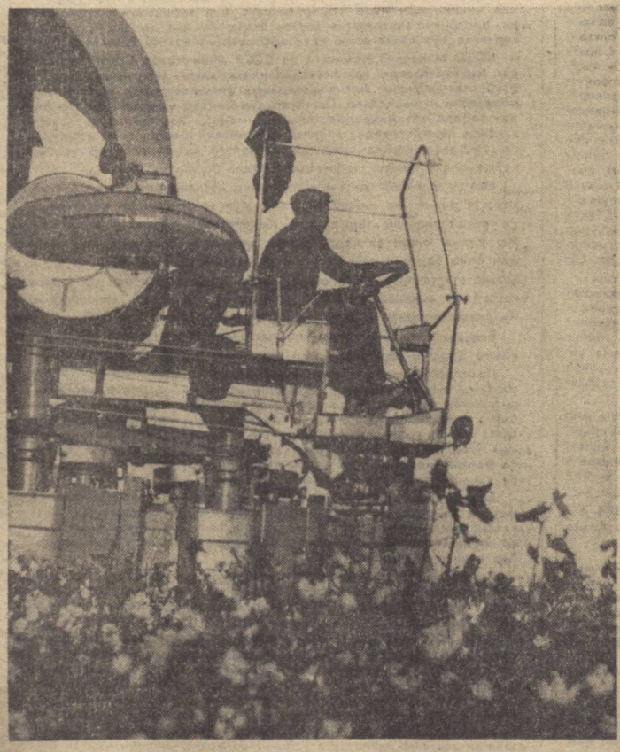
Бухоро область, Қоракўл районидagi «Москва», «Правда», Навоий номи ва Киров номи колхозларда машина терими қизитиб юборилди. Суратда: «Москва» колхозини даласида машина теримига киришилган пайт тасвирланган.

Койил қолдим машинанинг ишига, Пахта терар, ёрдам берар кишига. Мададкор теримда қари — ёшга, Машина одамга дўст, ҳамкор экан, Афсона тўқришга ҳожат йўқ энди, Машина теримда. Кўнгли тўқ энди, Ужар ҳам тан бериб, дер: «Қуллук энди», Машина олқишга сазовор экан. Кўчкор ТЕШАБОВЕВ.