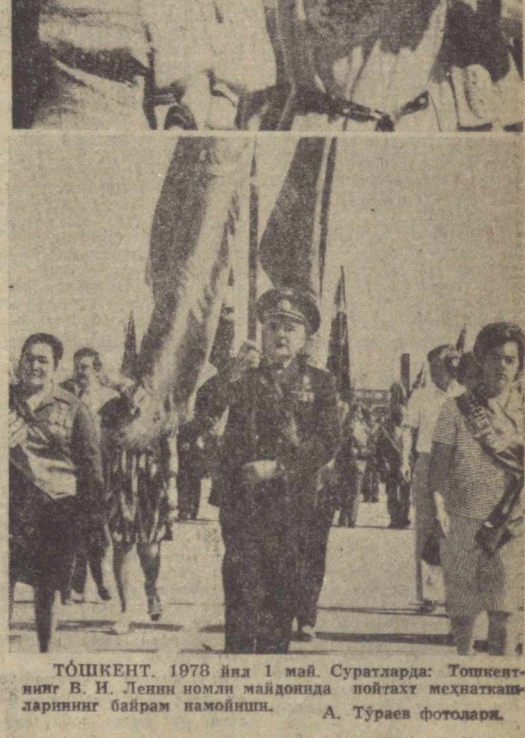
ТОШКЕНТ. 1978 йил 1 май. Суратларда: Тошкентнинг В. И. Ленин номи майдонинда пойтахт меҳнаткашларининг байрам намоёиши.