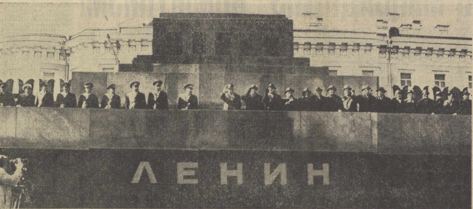
МОСКВА. 1978 йил 1 Май. Биринчи Майнинг байрам ҳилиниши. Қизил майдонда меҳнаткашлар вакиллариининг намоёиши. Суратда: В. И. Ленин Мавзолеининг минбариди.

Кеча Советлар мамлакатининг барча халқлари, шу жумладан Ўзбекистон меҳнаткашлари тинчлик, меҳнат ва баҳор байрами—1 Майни Коммунистик партия ва улуг Ватанимиз билан чексиз ифтихор туйғуларига тўлиб-тошган ҳолда нишонладилар. Байрам тантаналари халқимизнинг КПСС XXV съезди тарихий қарорларини ва ўнинчи беш йиллик планларини бажаришга қатъий азму қарор қилганлигини намоёиш этди.