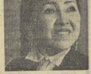
Халима НОСИРОВА. СССР халқ артисти...