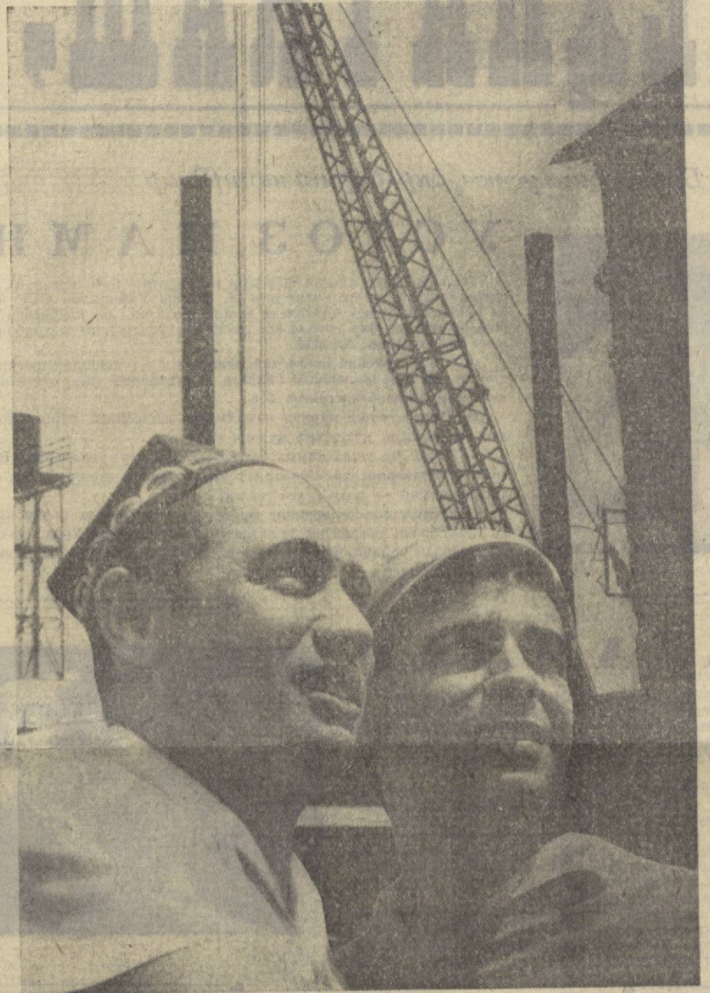
Тошкент экскаватор-ремонт заводининг меҳнатсевар ишчи, инженир-техник ходимлари СССРнинг ярим асрлик олтин юбилейи шарафига муносиб армуғон ҳозирлаш учун жон куйдириб меҳнат қилмоқдалар.

Барча галабаларимизнинг илҳомчиси ва ташкилотчиси шонли Коммунист партияси, инженир-техник ходимлари СССРнинг ярим асрлик олтин юбилейи шарафига муносиб армуғон ҳозирлаш учун жон куйдириб меҳнат қилмоқдалар.