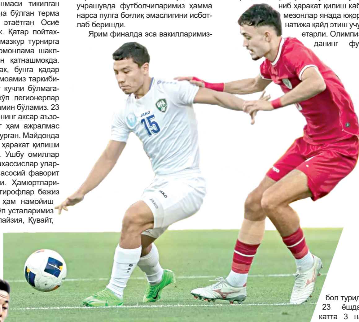
бол турида 23 ёшдан катта 3 нафар футболчи

ди. Бугун шу "қора аъна"га барҳам берилди. Тарихий натижа қайд этган вакилларимизда уни янгилаш имконияти мавжуд. Ҳар ҳолда иқтидорли футболчилардан иборат таркиб, кучли рақобат, бир-бирини жуда тез тушуниб ҳаракат қилиш каби мезонлар янада юқори натижа қайд этиш учун етарли. Олимпиаданинг фут-