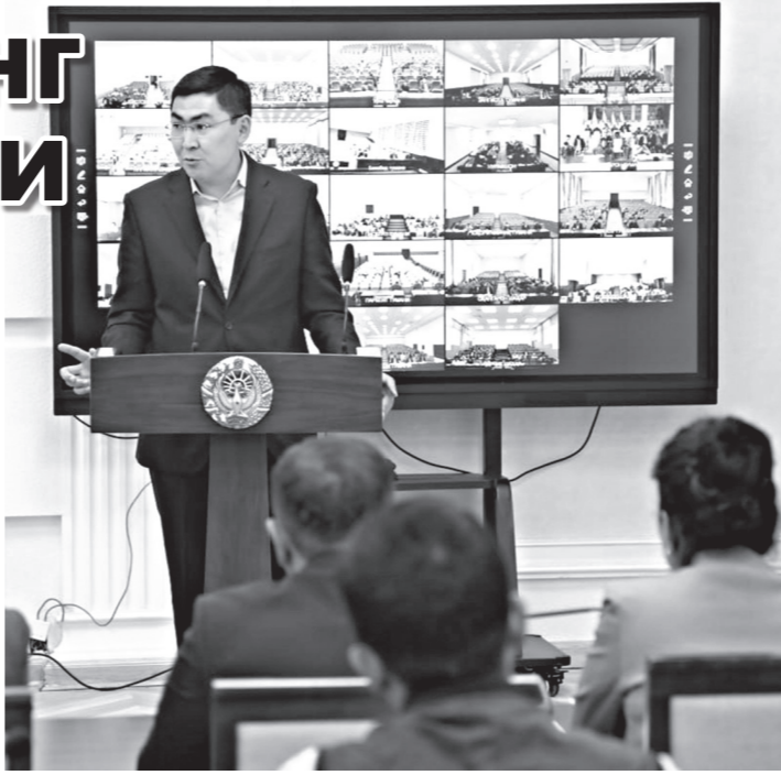
Раҳбарларига ҳайфсан берилди. Яқунда муҳокама қилинган масалалар юзасидан алоҳида чора-тадбирлар

фаррошларнинг фарзандлари, ота-онаси озодликдан маҳрум бўлган болаларнинг ёзги оромгоҳларда дам олиши чоралари кўрилади. Шунингдек, йилги давомда республика ишчи гуруҳи томонидан 22-26 апрель кунлари вилоятда ўтказилган ўрганиш натижалари танқидий муҳокама қилинди. Унга кўра, вилоят "Сувтаъминот" МЧЖ, "Худудий электр тармоқлари" АЖ Тошкент вилояти ҳудудий филиалларида маънавий-маърифий ишлар ҳолати қониқарсиз эканлиги танқид қилинди. Республика Маънавият ва маърифат марказининг Бекобод ва Қўйраб туман бўлинмалари