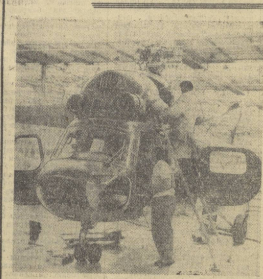
Польша Халқ Республикаси нинг самолётчилари Совет Иттифоқи вертолётлар кўпчилигини диққатини ўзига тортимоқда. Суратда: «МН-2» вертолети ни йиғиш пайти.

ПРАГА. 14 сентябрь. Чехословакия Коммунистик партияси Маршаллий Комитетининг Бош секретари Г. Гусак Чехо-Словакия Социалистик Республикасининг Президенти Ў. Свобода, ЧССР ҳукуматининг Раиси Ј. Штрогал ҳамда партия ва республика ҳукуматининг бошқа раҳбарлари машқларнинг боришига кузатиб турдилар. Варшава Шартномасида қатнашувчи давлатлар Бирлашган қуроли кучларининг Бош қўмондони, Совет Иттифоқи Маршалли И. И. Якубовский, СССР мудофаа министри, Совет Иттифоқи Маршалли А. А. Гречок, Варшава Шартномасида қатнашувчи давлатларнинг мудофаа министрлари, бошқа ҳарбий раҳбарлар ҳам шу ерда бўлишди.