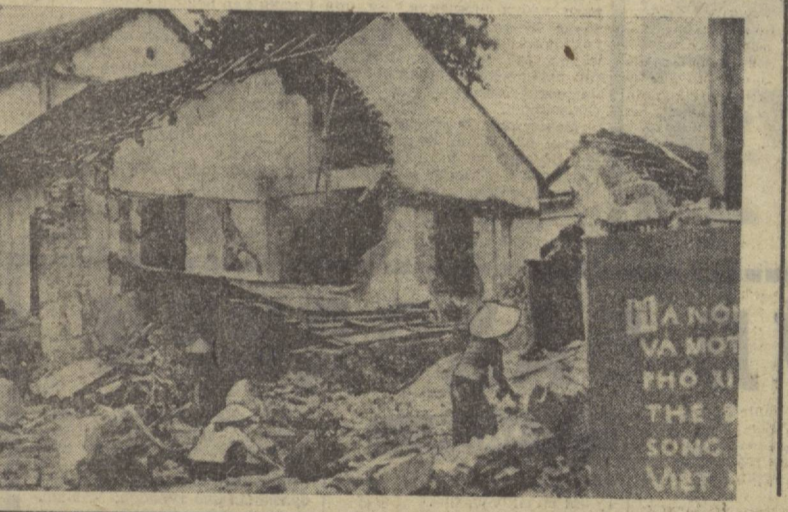
Америка авиацияси Вьетнам Демократик Республикасининг аҳоли пунктларини ақшияларга бомбардимон қилиши натижасида қирқилган биноларнинг қолдиқлари.

ЛОНДОН. (ТАСС). Англия комсомоланин миллий секретари Том Белл Буюк Британия Коммунистик партияси ишчи комитетининг мажлисида гашириб, 18 ёшгача бўлган ишчилар билан ва қизларидан 105 миз нафардан кўпроқ ишчи узларининг ҳаётларида биринчи марта иш толиш имкониятидан маҳрум бўлиб юлмоқдалар, деди. Меҳнатчиларнинг турмуш даражасига ва ҳуқуқларига ҳуқуқ қилиётган консерваторлар ҳукуматининг сиёсати натижасида, деди Том Белл, ишларнинг меҳнат қилиш иш ўқишини давом эттириш имконияти