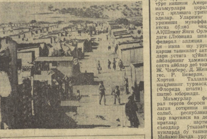
Исроил бошқинчилари араб территорияларида туб аҳолига тобора оғир жабр-зулм ўтказмоқдалар. Бошланаси қолган минг-мигда фаластинликлар бошқа мамлакат территориясинда жой излашга мажбур бўлмоқдалар. Суратда: Норданияда фаластинлик қочқинлар учун қурилган лагерь.