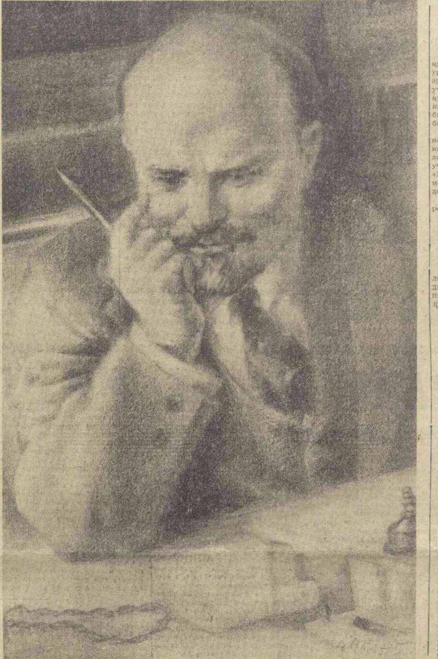
Рисом С. Малъ чизган расм.

Коммунистик партия илхомчи ва раҳнома бўлган, улуғ Ленин голларига содиқ совет матбуоти Ватанимизда, бутун дунёда инсоний баҳорининг тўла тантанаси учун, коммунизм галабаси учун бундан кейин ҳам ҳўрмай-толмай хизмат қилади.