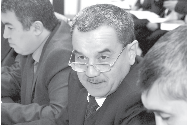
А Шовот туманининг Чиғатой-қалъа қишлоғида барпо этилган маъсулияти чекланган жамият шаклидаги «Uztex Showot» қўшма корхонасининг ўз ўрни бор. Истиклолимизнинг 24 йиллик байрами арафасида «Uztex Showot» таркибидан яна бир қўшма корхона — «Шовот текстиль» фой-

муваффақиятсизликка юз тутиб, инкирозга учраши муқаррар. Кези келганда, яна бир нарсани аниқ айтиш керак: ҳар қандай сиёсий партия, унинг ҳудудий ва қўйи ташкилотлари ўзи фаолият кўрсатаётган минтақа ҳаётининг томир уришини яхши ҳис қилиши, энг муҳим соҳалардаги ўзгаришларни пайкай олиши, бу жараёнларда фаол иштирок эта билиши керак. Яъни, сизга давлатимиз раҳбарининг маърузасида Хоразм вилоятининг саноат салоҳиятини ошириш борасидаги натижаларга мамнуният билан тўхталиб ўтилганини ҳам эслатмоқчиман. Ҳақиқатан ҳам, Ўзбекистон Республикаси Президентининг «2013-2015 йилларда Хоразм вилоятининг саноат потенциалини ривожлантириш дастури тўғрисида»ги қарори воқо раванқидан янги саҳифалар очди. Мисол учун, тугаётган йилнинг биринчи ярмида «Хоразм автомобиль ишлаб чиқариш бирлашмаси» маъсулияти чекланган