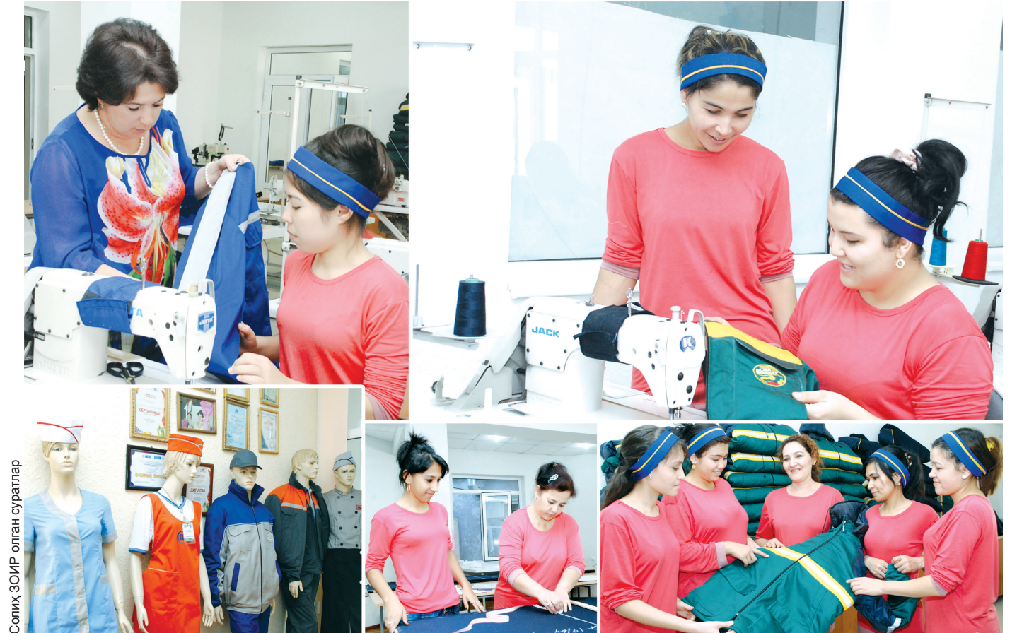
Соғим 300/Р олган суратлар