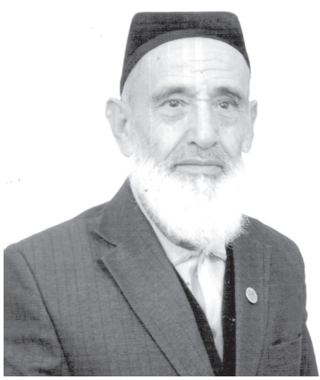
У кишини нафақат Фарғонада, балки республикада қўлчилик танийди. Бойси унинг ижтимоий-иқтисодий, маънавий-маърифий соҳаларда амалга оширилган ислохотлар ҳақида хикоя қилувчи хабарлари ҳозиргина тандирдан узилган қўлчилик га-зетчоларга етиб борапти. Сизни асл касби ўқитувчи бўлган, чорак асрга яқин Марғилон шаҳар ҳокимлигида турли вақфларда ишлаган ҳожи отани қўлга қалам олишга нима ўндаяпти, деган савол қизиктириши табиий. — Менинг илҳом манбаим — МУСТАҚИЛЛИК, — дейди у. — Муҳтарам Юртбошимиз бошчилигида 24 йилда қўлга киритилган улкан ютуқлар, амал-

Сўнги соатлари ўтиб бораётган 2015 йил мен учун унутилмас воқеаларга бой бўлди. ЎзМУнинг дипломини олар чоғида Тадбиркорлар ва ишбилармонлар ҳаракати — Ўзбекистон Либерал-демократик партияси аъзолигига қабул қилиндим. Ёшларга оид давлат сиёсати янада қизиқиб ўрганишга киришдим. О'zLiDePнинг Тошкент шаҳар кенгашида ишлаб бошлаганим эса назарий билимларини амалиётда қўллаш учун катта шароит яратди. Устозлардан ўрганган ўқитилган ҳаётида қўллаб, сиёсий майдонда партияимиз обрўсини мустаҳкамлаш, халқимизга хизмат қилиш имкониятига эга бўлдим. Конституцияимизнинг 23 йиллигига бағишланган маросимдаги маърузани ўзгача бир ҳаяжон билан тингладим. Айниқса, АҚШда фаолият кўрсатаётган, Гэлпал институтини деб ном олган ижтимоий фикрни ўрганиш маркази томонидан ўтказилган «Қонуний тартибларга итоат қилиш индекси» мавзусида 2015 йилда ўтказилган тадқиқот натижаларига кўра Ўзбекистонимиз дунёдаги 141 та давлат орасида 2-ўринни эгаллаганини эшитиб, тинч-осойишта, тобора юксалаётган юрт фарзанди эканлигимдан қалбим гурур ва ифтиخорга тўлди. Келаётган йилнинг Соғлом она ва бола йили деб эълон қилиниши замирида ҳам эртага юрт қорига ярайдиган, ҳар жиҳатдан соғлом ва баркамол авлодни волега етказишдан эзгу гуя муҳассасидир. Жасурабек ҚОДИРОВ, О'zLiDeP Тошкент шаҳар кенгаши етакчи консултанти.