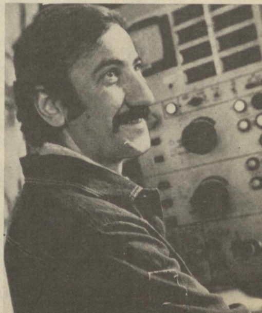
Шарманов (Тошкент области) шахридаги республика Мелiorация ва сув хўжалиги министрлигининг иқтисослашган ишлаб чиқариш бirlашмаси корхонаси «СНП-500/10» маркали кўпча насос станциялар яратмоқда. Улар экин майдонларига

(Ўзбекистон Компартияси Марказий Комитетининг Қўқон ип йиғирув-пайпоқ тў-қув комбинати ва Самарқанддаги «Хужум» пиллакашлик фабрикаси коллективлари-нинг ташаббуси ҳақидаги қарордан).