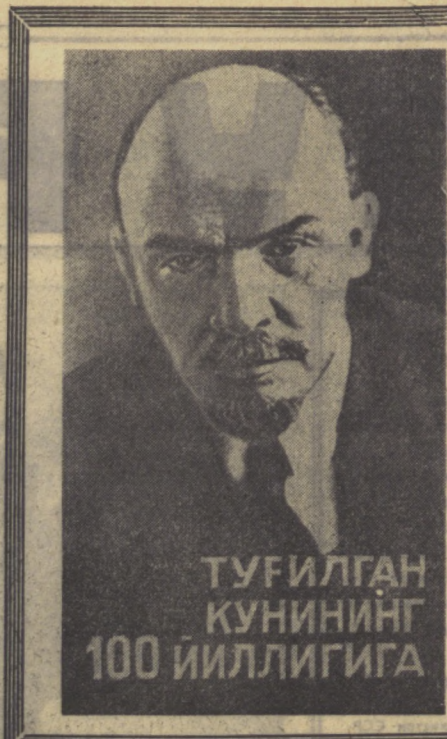
ТУГИЛГАН КУНИНИНГ 100 ЙИЛЛИГИГА

Буюк пролетариат доҳииси В. И. Лениннинг «Туркистондаги коммунист ўртоқларга» деган машҳур хати совет ҳокимиятининг дастлабки йилларида Туркистон коммунистлари олдида турган муҳим вазифаларни белгилаб берди.