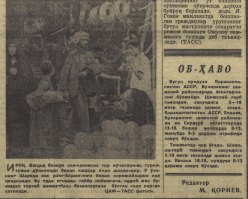
ИРОҚ. Бағдод бозори сон-саноксиз тор кўчаларини, туриш-тушман дўноқлари билан «шаҳар ичра шаҳар»дир. У заминдан Шарфа хос ранг-баранглиги билан хоржиқларнинг дол қодирдир. Бу ерда ичрадан тайёр қилинганча, оддий мис бўлган тортиб қимматбахо безиларгача бўлган «ҳар нарсаси» сотилади.

Я. ГОВОННИНГ АЙТГАНЛАРИ ЛАГОС. Нигерия ҳарбий ҳукумати Окукуви сепаратистлар мамлакатни бўлиб юборганидан воз кечадиган бўлсалар, уларга қарин уруш ҳаракатларини тўхтатишга тайёр эканлигини яна бир бор тасдиқлади. Нигерия ҳарбий ҳукуматининг бошлиғи генерал-майор Якубу Говон шундай қилинадиган бўлса, Нигерия федерал кўшинларининг ўт очишини тўхтатиш тўғрисида дарҳол буйруқ берилди, деди. Я. Говон мамлакатда бошланган граждандар урушининг бутун масъулияти сепаратчи режим бошлиғи Окукуви зиммасига тушади деб таъкидлади. (ТАСС).