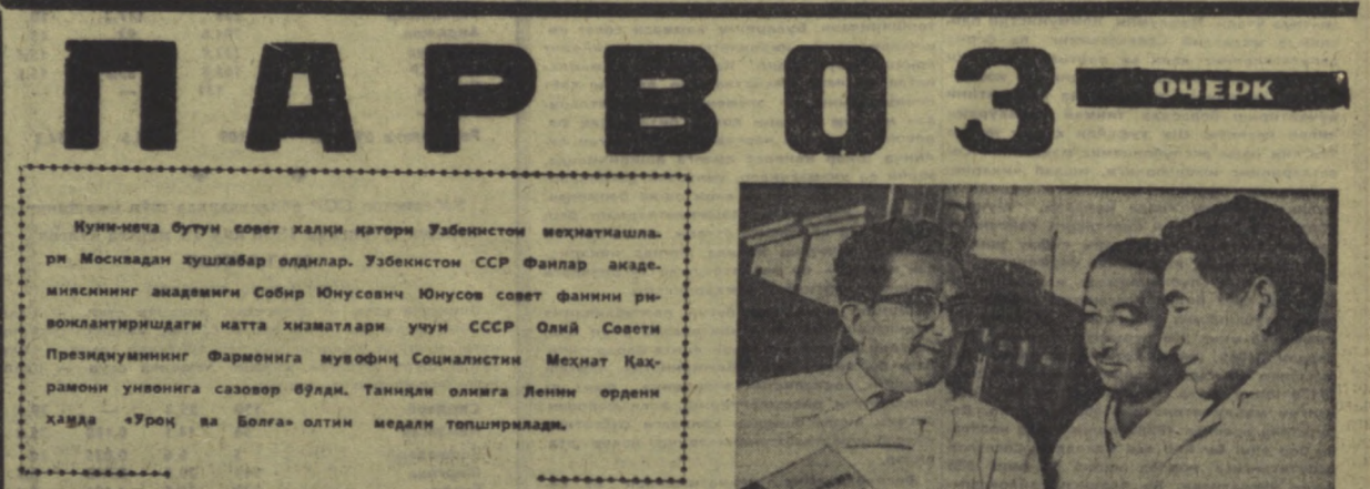
Академик Собир ЮНУСОВ (чапда) ҳаммаси шогирдлари билан.

Кунинича бутун совет халқи қатори Ўзбекистон меҳнаткашлари Москвадан хушхабар олдилар. Ўзбекистон ССР Фанлар академикларининг академиги Собир Юнусовни Юнусов совет фанини ривожлантиришдаги катта хизматлари учун СССР Олий Совети Президиумининг Фармониға мувофиқ Социалистик Меҳнат Қазрамони унвонига сазовор бўлди. Таъкид олиғига Ленин ордени ҳамда «Уроқ ва Болға» олтин медали топширилди. Олам кўклар таровати билан маст. Кўп буйи чимсасиз килваттоқлар қўнини кезиб, турли тўбх намуналарини янқдан янғити тоғ анбарига келганда бир паст нафасни ростиб олгани ўзини кўнгалар орасига ташлади. Шу дам шабада унинг чарчогини сезгандек, узоқларда қўпони найининг орналовчи ёқимли сасини ҳаёт этиб кетди. У лабларида ўт ўйнаб, мусаффо осмонга тикилганча, нафталарни яқин қилиб ётарди. Қаврдандир кўтарилган бурғут жулларга парвоз қилди. Пянт унинг полча-пол қўқиллар оша балавдлаб-боринини кўзатар экан, ўзича ўйларди: — Қўларга кўтарилдиш учун қушга қанот қанчалик керак бўлса, фанини мисасиз тараққийёт босқичига кўтариш учун олимларга билим, келусини тасаввур этиш шунчалик зарур. Собир, — деди у ўзича-фан, — чинакам химия, табииятнинг сирдоли учун ҳали кўп ўқишинг, ўрғанишинг, меҳнат қилишинг керак. Кўчнинг, қунтинг етадимми? Етади, етади... Шу маъал ҳамкуреларининг овози эшитилди: — Собир, Юнусов: — Озот ўрчидан турган йиғит, ҳозирроқ бургут янғилиги би-