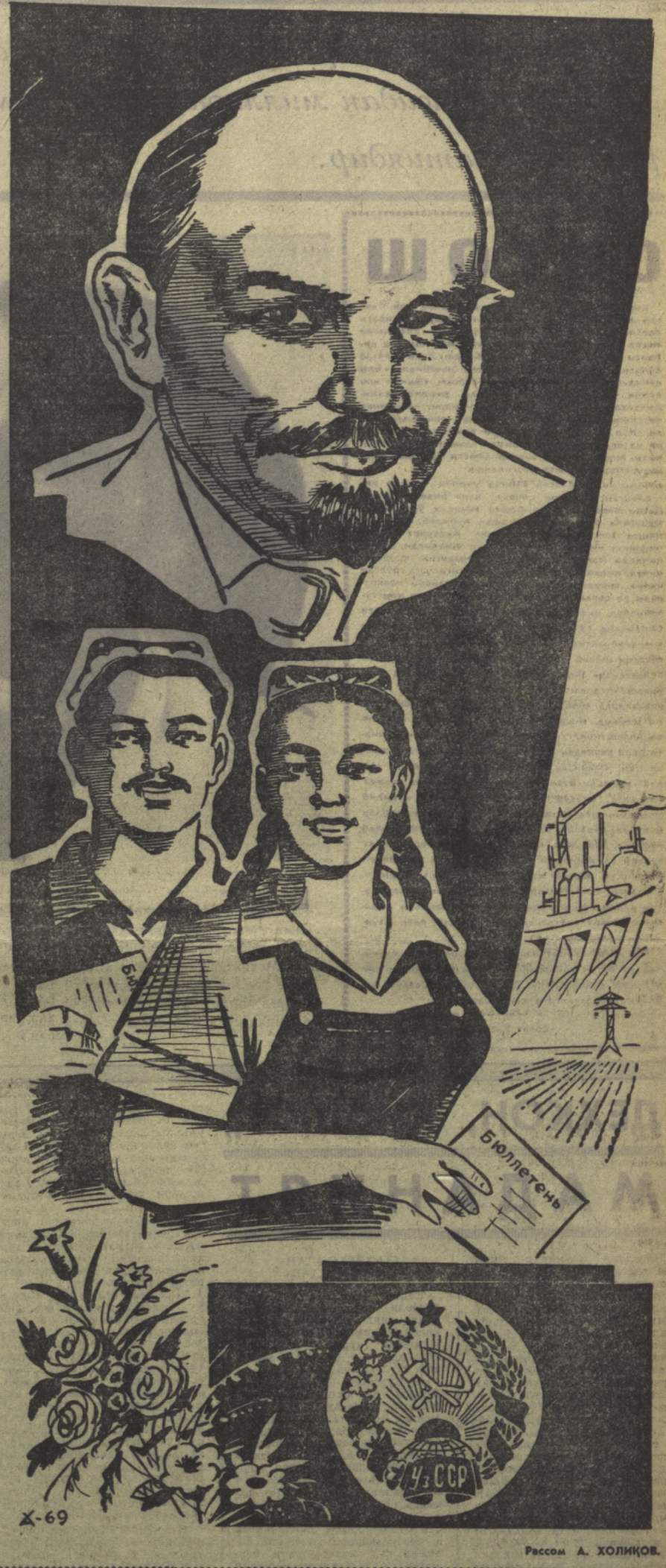
Рисом А. ХОЛИҚОВ.