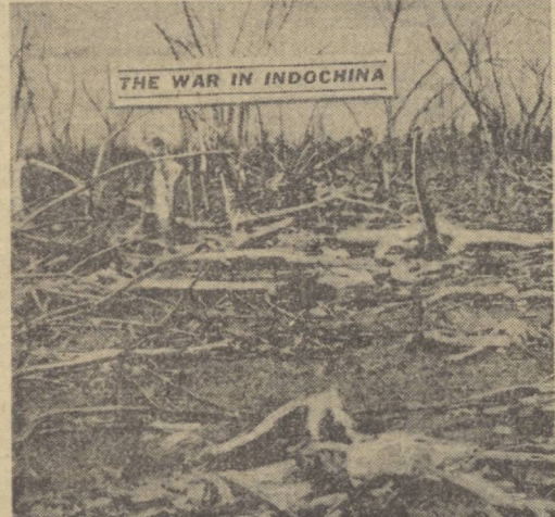
THE WAR IN INDOCHINA

Бундан бир неча йиллар аввал Меконг дарёсининг бўйлаги ям-яшил дарактоғлар билан қопланган эди. Эндиликда бир неча ўз километрча қузғин кетган бу қирғоқларда бирор тинмайган дарак йўқ. Шонинга, макмакхўрзорлар, мезозорлар тупроқ билан баробар қилинди.