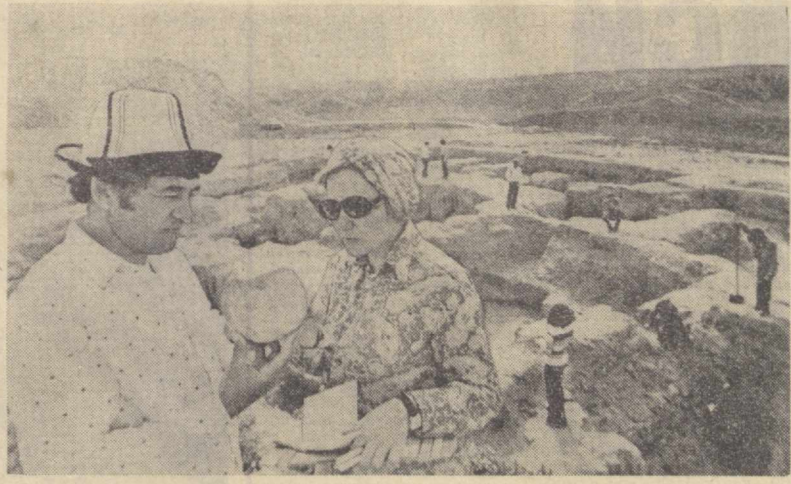
Ўзбекистон ССР Фанлар академиясининг Археология институтини мутахассислари қадимий Афросиёбда археологик тадқиқот ишларини давом эттирмоқдалар. Бу ерда қадимги замон цивилизациясининг ёнғори ношуналар топилади.

18.45 — Мультифильм, 19.05 — «1978 йил кўшиқлари», 19.35 — «Вазият» (фильм-спектакль), 21.30 — «Вақт», 22.00 — «Салом, фестивал», 23.30 — Концерт, 00.15 — Янгиликлар.