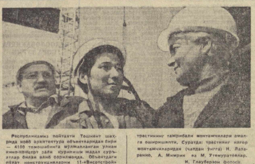
Республикамиз пойтахти Тошкент шаҳрида ноб архитекура объектларида бири — 4100 томошабинга мўлжалланган Улкан кино-концерт зали қурилиши жадал суръатлар билан олиб боришмоқда. Объектдаги пўлат-конструкцияларни 11-«Висотстрой»