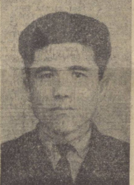
Далалардаги ҳосил тўла йиғиштириб олинмагунча, социалистик мабуриятлар шарафига бажарилмагунча бирорта машина ёки теримчи пайкадан чўчиб кетмаслиги керак. Широн тўхтаб олиниб, ҳар бир ҳўжаликда терим трафики қайта кўриб чиқилиши, ҳар бир механизатор ва теримчи, шаҳарли ердамчиларнинг ҳаммасига маълум муддатга мўлжалланган конкрет тошириқ бериш лозим. Масалан, мен шу кунгача 450 тонна пахта тердим. Яна 150 тонна тераман. Бунинг учун кунлик суръатини 7-8 тоннадан камайтирмайман.

Ютуқларимиздан қувонимиз, албатта. Ленин пахтакорларимиз ҳали кўп вазифаларни ҳал қилишлари лозимки, бунинг учун тўқимиз керак. Масалан, районимиз бўйича 50 миң тонна, совхозимиз бўйича 12 миң тонна пахта тайёрлашимиз керак. Бошқа ҳўжаликлар ҳам ўз зиммасига конкрет тоширишлар олишган. Бригадамида ҳосилдорлигини гектар бошига 40 центнерга етказишимиз лозим. Бугунги кунда ҳосилдорлик 31 центнерга етди, пахта бунгига ғалаба байроғи тикмоқ учун нима қилмоқ керак?