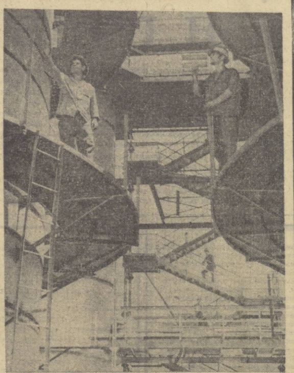
СОВЕТ КИТОБЛАРИ ВИСТАВКАСИ