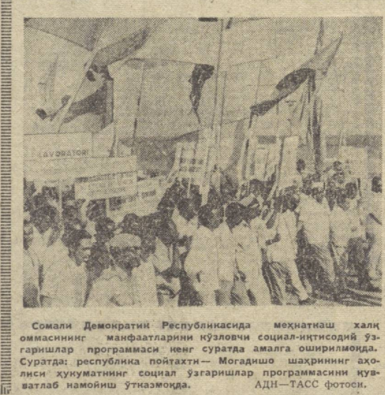
Сомали Демократик Республикасида меҳнатнаш халқ оммининг мағфалларини қувчилик сошиал-интисодий ўзгартириш программаси нег суратда амалга оширилмоқда. Суратда: республика пойтахти — Могадишо шаҳрининг аҳоли хукуматининг сошиал ўзгартириш программасини муволаб намуниш ўтказишда.

Сайгондаги қийинчиликлар дейлади баёнотда, гап Америка мажбуриятларининг бажарилишини кечиктириш учун қилинётган баҳонадир ҳолос, дейлади баёнотда.