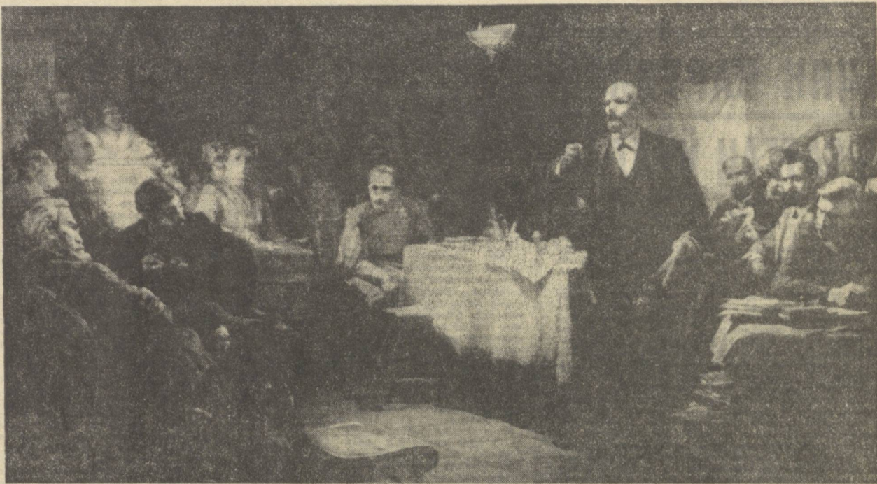
РСДРПнинг II съезида.

Илгор назария билан қуролланган янги тивдаги партия тўғрисидаги ленинча таълимотнинг муҳимлиги ва ҳаётининг КПСС ва бошқа қардош партиялар тажрибаси ёрқин тасдиқлади.