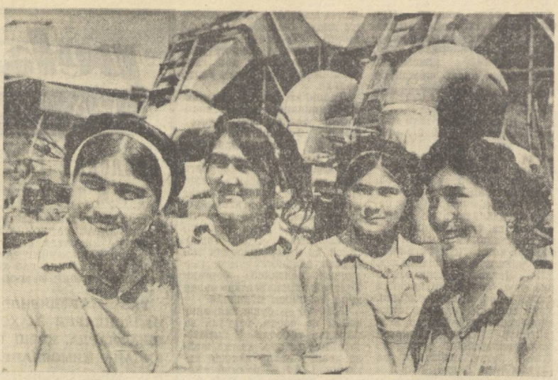
Буз районидagi «Партия XX съезди» илкчи чорвадорлари...