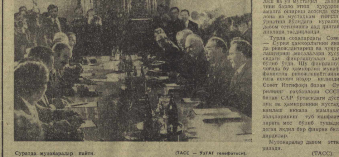
Суратда: музокаралар пайти.