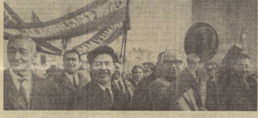
ТОШКЕНТ. 1972 йил 7 ноябрь. Суратда: меҳнатқашларнинг байрам намоишлари.