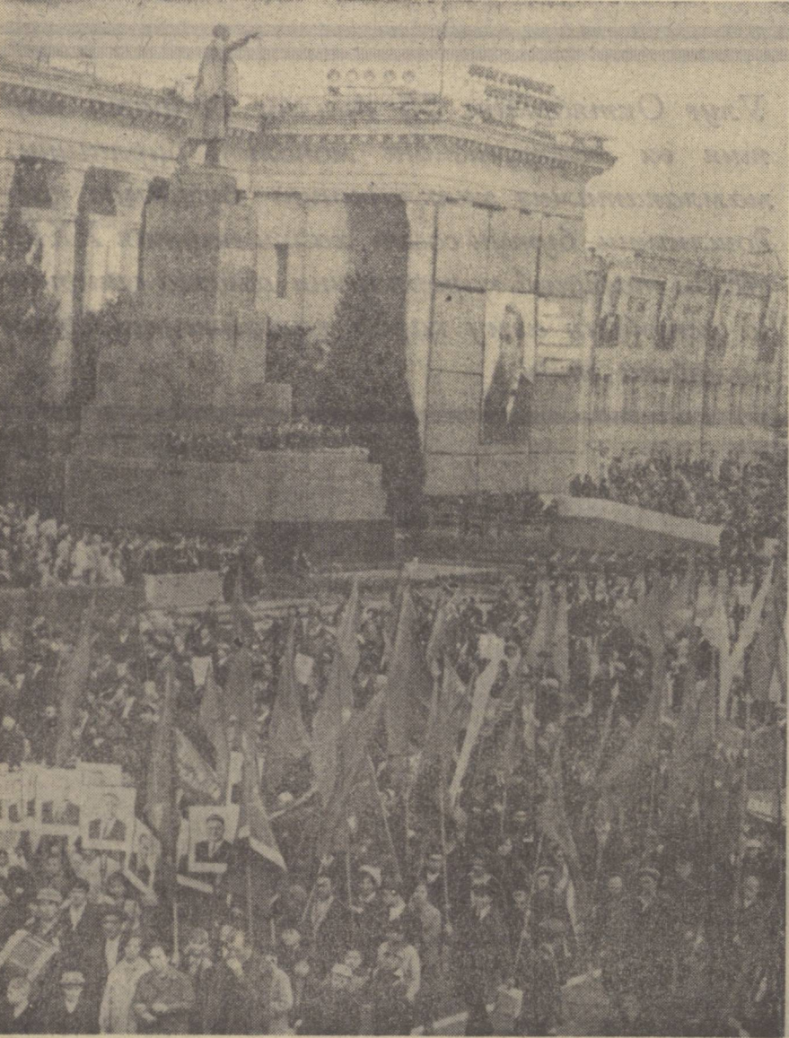
ТОШКЕНТ. 1972 йил 7 ноябрь. Ленин номи майдонда меҳнаткашларнинг байрам намоишлари.

(Боши биринчи бетда). ёздамига тилини, ҳосил учун курашда мушкул синювларга шараф билан бардош бердилар. Совет кишиларининг моддий фаровонлиги ва маданий савияси халқ ҳужалигининг муваффақиятлари асосида тўхтовсиз ўсмонда.