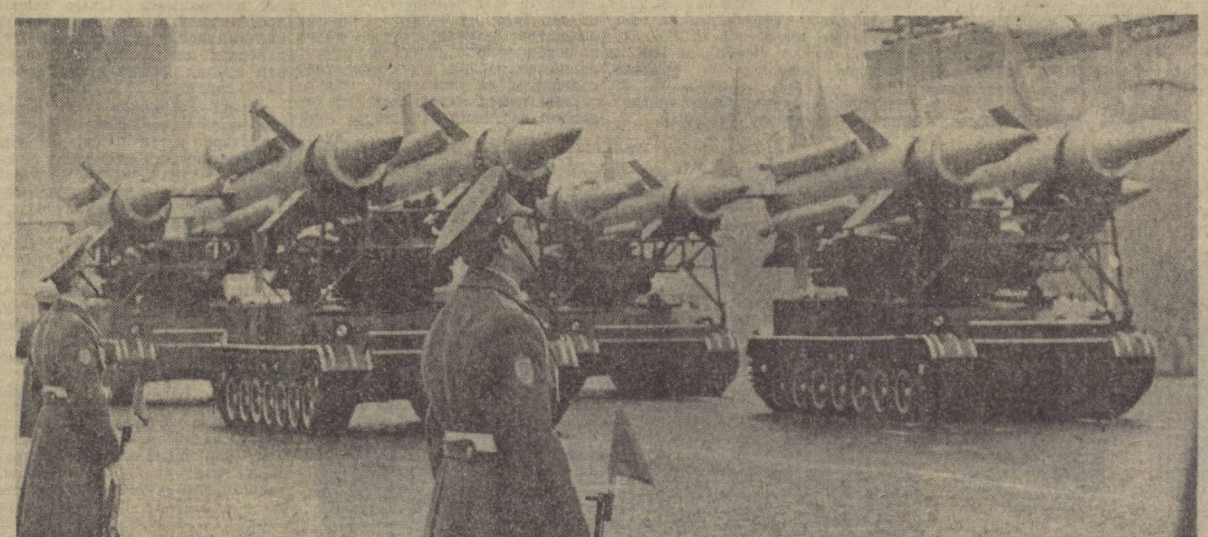
МОСКВА, 1972 йил 7 ноябрь. Суратда: ракеталар маршида.

Қабул маросими қатнашчиларига байрам концерти қўйиб берилди. (ТАСС).