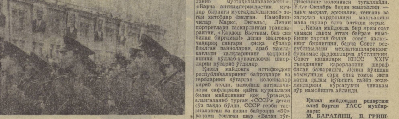
А. Тўраев фотолари.