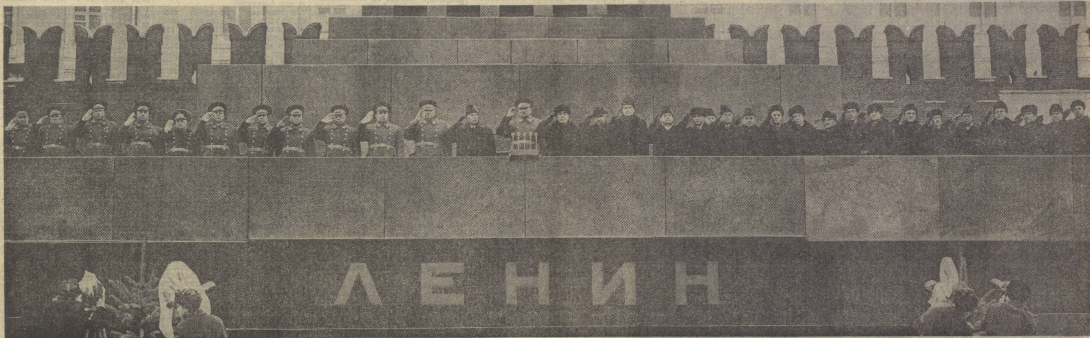
МОСКВА, 1972 йил 7 ноябрь. Қизил майдон. В. И. Ленин Мавзолеий минбарига.

Улуғ Октябрнинг 55 йиллик байрами партия ва халқимизнинг монолит бирлигини, мамлакатимиз халқларининг бузилмас қардошлигини, бутун совет халқи партия XXIV съезди тарихий қарорларини амалга оширишга астойдил азму қарор қилганини ёрқин намойиш этди.