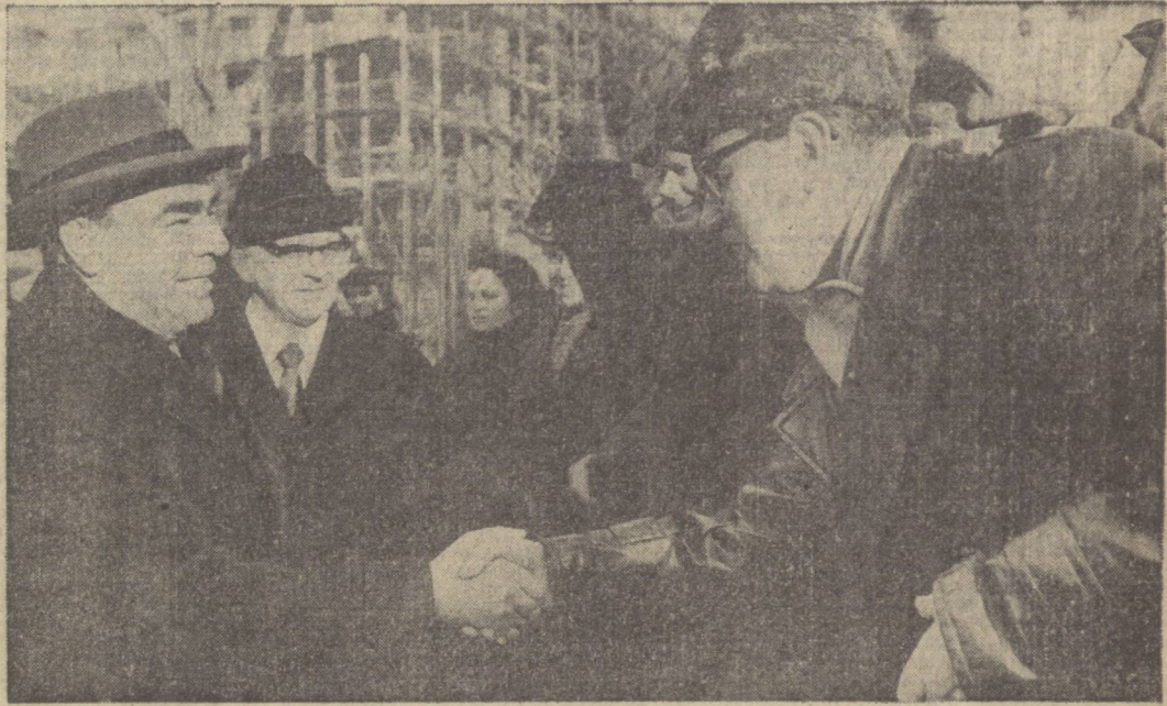
БУДАПЕШТ. Озодлик майдони. Ўртоқ Л. И. Брежнев Венгрия пойтахти меҳнаткашлари орасида.